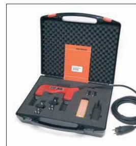
DEUTROPULS 磁探钳及其附件装在一个结实的仪器箱里。