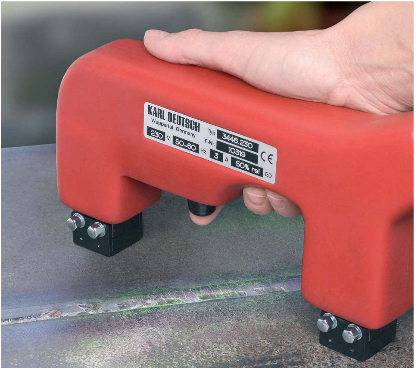
DEUTROPULS 磁探钳 便携式磁粉探伤仪