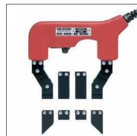
可根据不同的测量任务，选择不同形状的磁极。