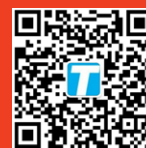
泰亚赛福官方微信

北京：400-000-1836 地址：北京经济技术开发区荣华北路亦城国际中心B座7层 上海：021-54248686 地址：上海市徐汇区宛平南路521号恒昌花园B座901室 网址：www.tayasaf.com